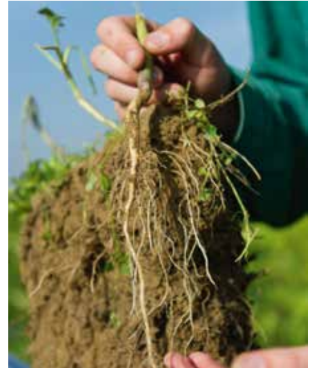
Bei Verdichtungen erreichen Wurzeln oft nicht den Unterboden

Bei manchen Achsen ist die Luftzuführung in der Achsmitte möglich. Bei Nachrüstungen werden zumeist außenliegende Leitungen verlegt. Bei 2-Leiter-Systemen wird in der Felge ein schaltbares Radventil mit Rückschlag-