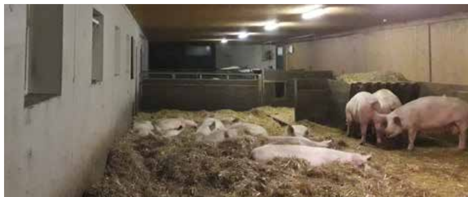
Am Betrieb Zotter ist eine Vernebelungsanlage im Einsatz