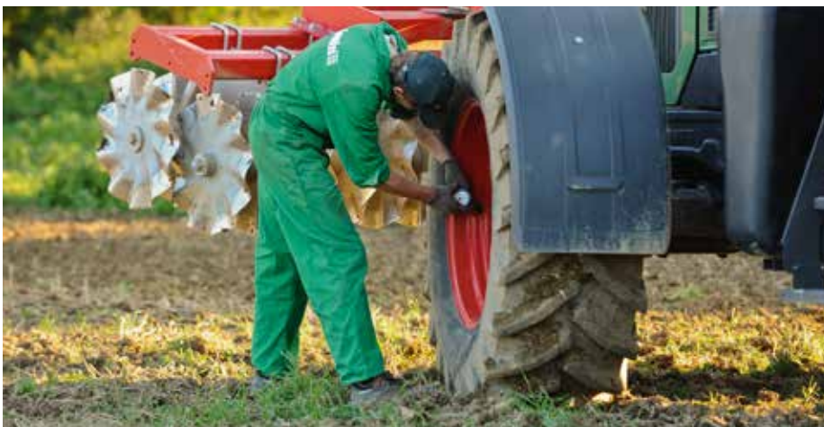
Der richtige Reifendruck ist wichtig

Artikel von DI Willi Peszt, „Reifen-druckanpassung in der Praxis“, erschienen im Mitteilungsblatt der LK Burgenland, www.bgld.lko.at