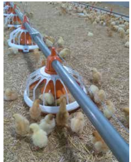
Eine gute Wärmedämmung ist wichtig