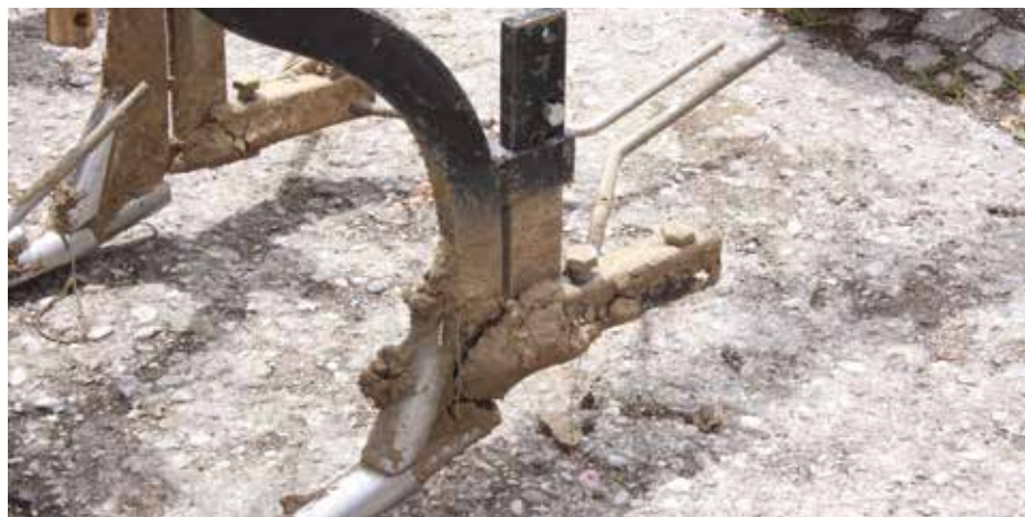
Hackdrähte sind variabel einsetzbar, können auch versetzt eingesetzt werden, um mit großen Mengen an Ernterückständen zurechtzukommen

So ist es möglich, dass sich das Gerät ohne weitere technische Hilfsmittel selbst exakt auf den Zentimeter genau führt. Nur die Unterlenker des Traktors müssen frei sein, um nicht den Lenkfehlern des Traktorführers ausgeliefert zu sein. Die Schare sind nur 5,5 cm breit und berühren daher, im Verhältnis zur Gesamtarbeitsbreite, kaum den