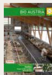
BIO AUSTRIA, Ausgabe 1/2016 zum Thema Stallbau

www.bioaktuell.ch/pflanzenbau/ackerbau/unkrautregulierung/direkte-massnahmen