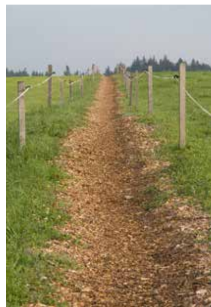
Tiergerechte Triebwege sind wichtig

Mangels Selektion und Lenkung des Tierverkehrs besteht die Gefahr, dass bei attraktivem Weidefutterangebot oder entsprechender Witterung die Tiere nicht ausreichend oft in den Stall und damit zum AMS kommen oder gegebenenfalls auch nur im Stall bleiben. Zu empfehlen ist der