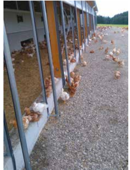
Der Außenscharrraum mit Planen-Rolltor

Jedenfalls blicken die Simmerstatters mit ihrem neuen Betriebszweig optimistisch in die Zukunft.