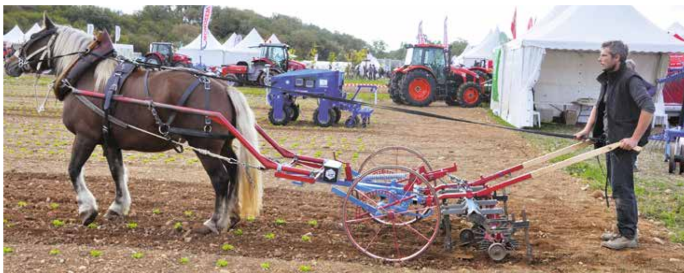
Zweimal ohne fossile Energie: Neue Maschinen für den Pferdezug im Vordergrund und ein elektrisch betriebener Hackroboter (Anatis von Carré) im Hintergrund

Interessant an den autonomen Unkrautrobotern wird sein, dass sie – mit Ersatzakku – grundsätzlich 24 Stunden pro Tag arbeiten könnten. Im Praxiseinsatz wird sich zeigen, wie intensiv die Betreuung sein wird und wie flexibel die Geräte auf Wetterbedingungen reagieren. So müssen die Roboter merken, wenn es zu regnen beginnt und die Bodenbedingungen nicht mehr stimmen. Für die Praxistauglichkeit wird zudem