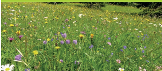
Biodiversität im Grünland fördern