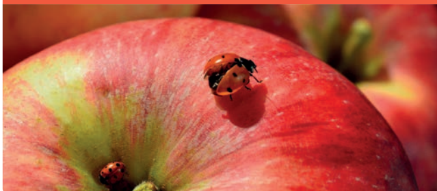
Biodiversität im Obstbau fördern