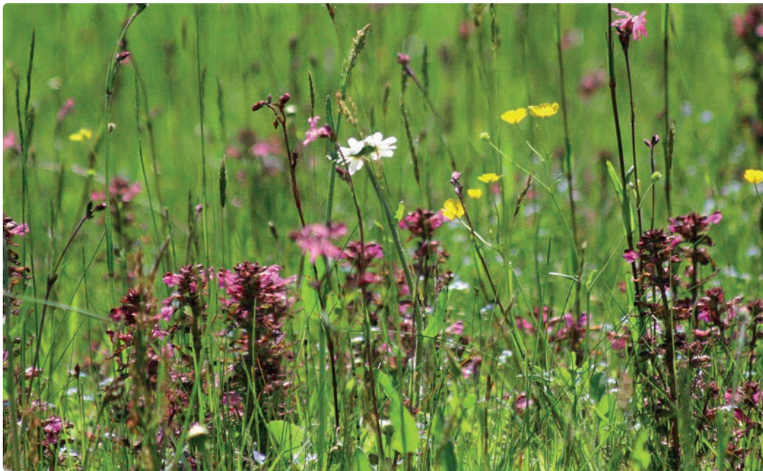
Margerite, Kuckucks-Licht- nelke, Ruchgras, Scharfer Hahnen- fuß, Läusekraut