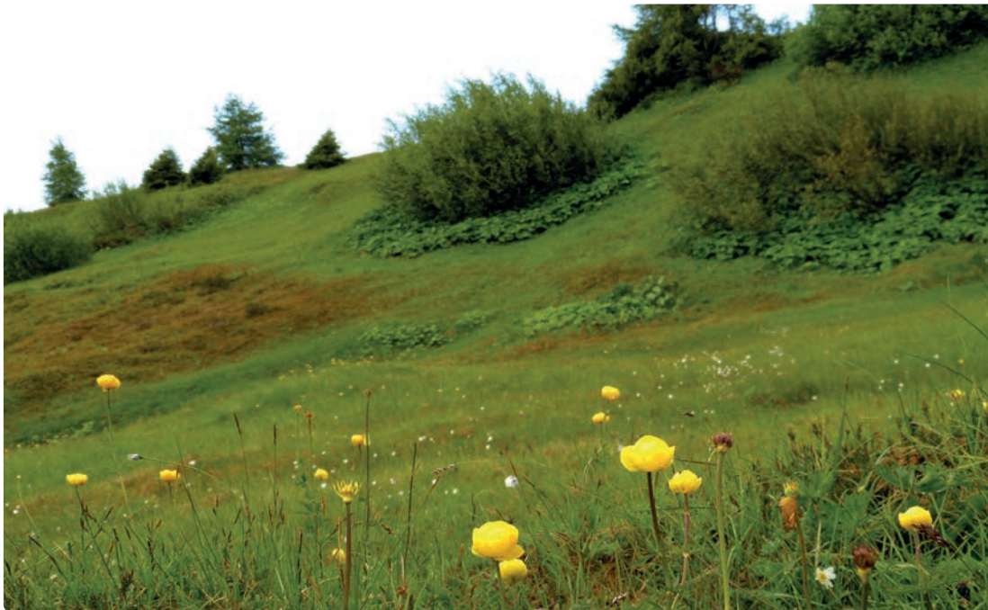
Feuchtfläche mit Trollblume und Wollgras