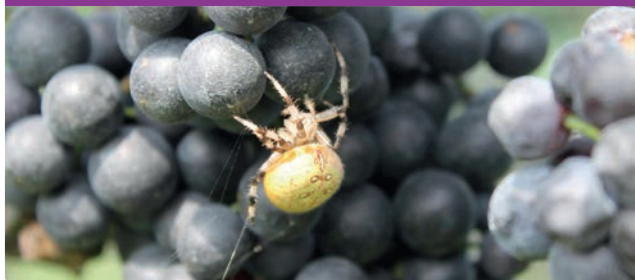
Biodiversität im Weinbau fördern