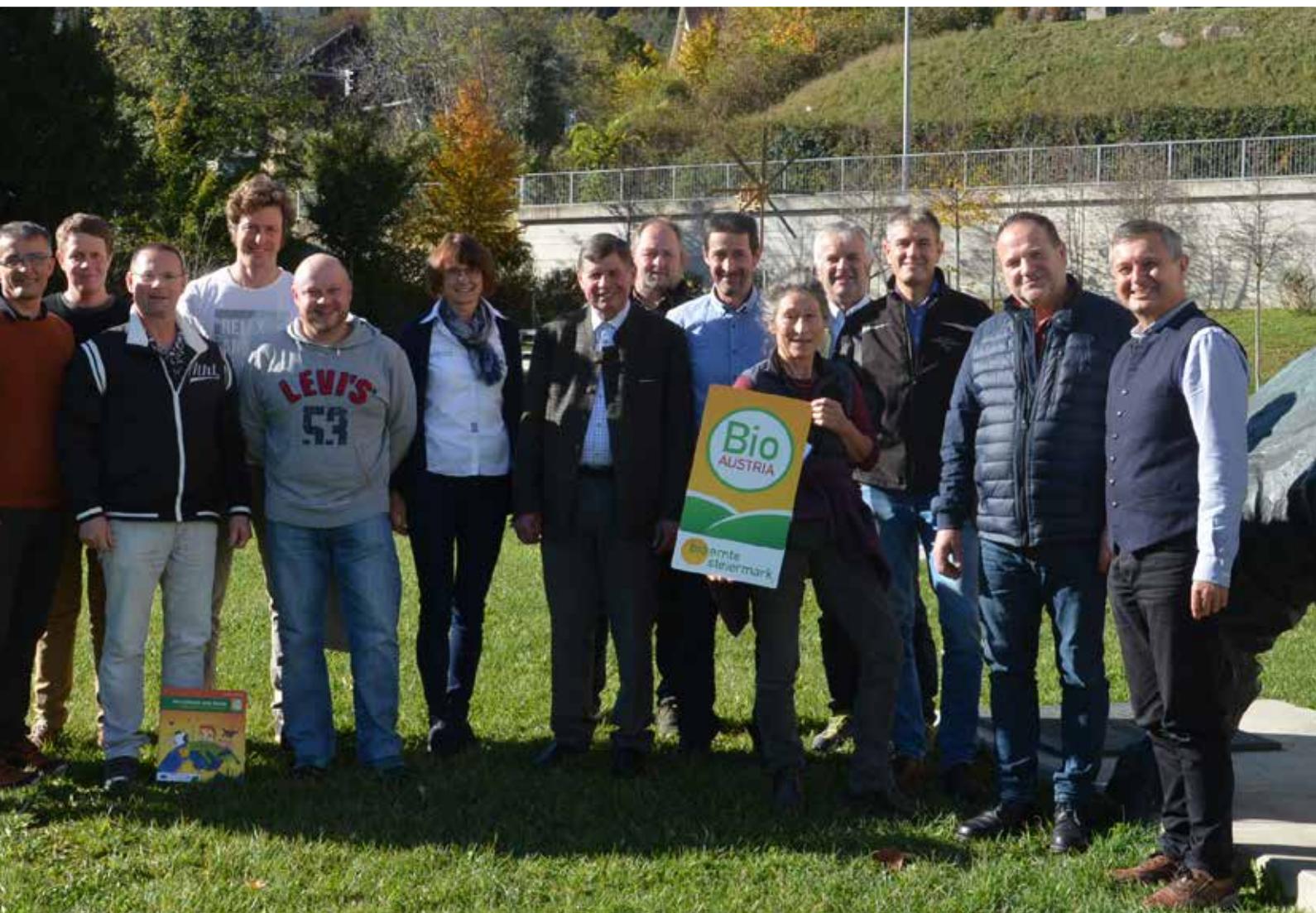
Regionalleiter (RL), Regionalleiter Stellvertreter (RLS), Delegierter (DL), Delegierter Stellvertreter (DLS), Milchsprecher (MS) (Stand 31.12.2023)