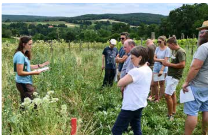
Kurstag am 13.07.2023 am Weingut Mons de Reuch