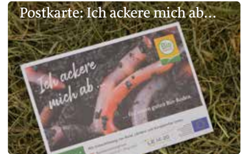
Postkarte: Ich ackere mich ab...