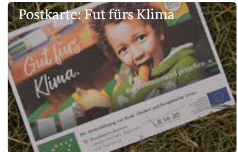
Postkarte: Fut fürs Klima