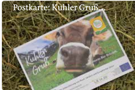
Postkarte: Kuhler Gruß