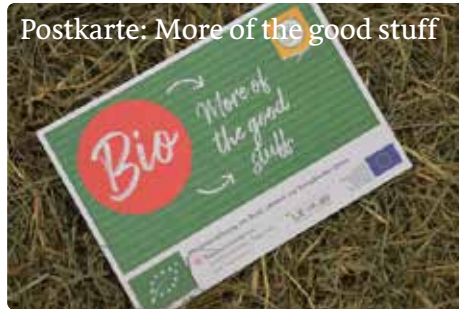
Postkarte: More of the good stuff