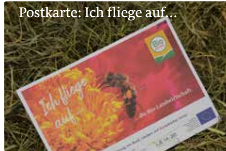
Postkarte: Ich fliege auf...