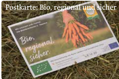
Postkarte: Bio, regional und sicher