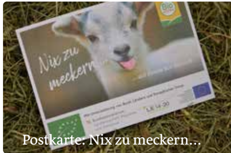
Postkarte: Nix zu meckern...